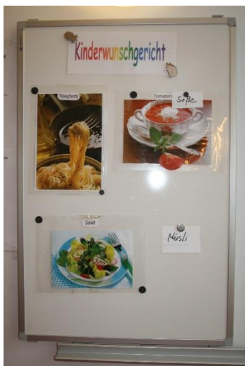
Kinderwunschgerichtstafel am 1. Tag

Während einer Kitaführung machen zwei Kinder den Forscher auf eine direkt neben der offen stehenden Küchentür angebrachte Tafel mit der Überschrift „Kinderwunschgericht“ aufmerksam.