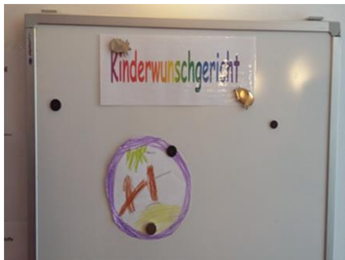
Kinderwunschgerichtstafel am 2. Tag